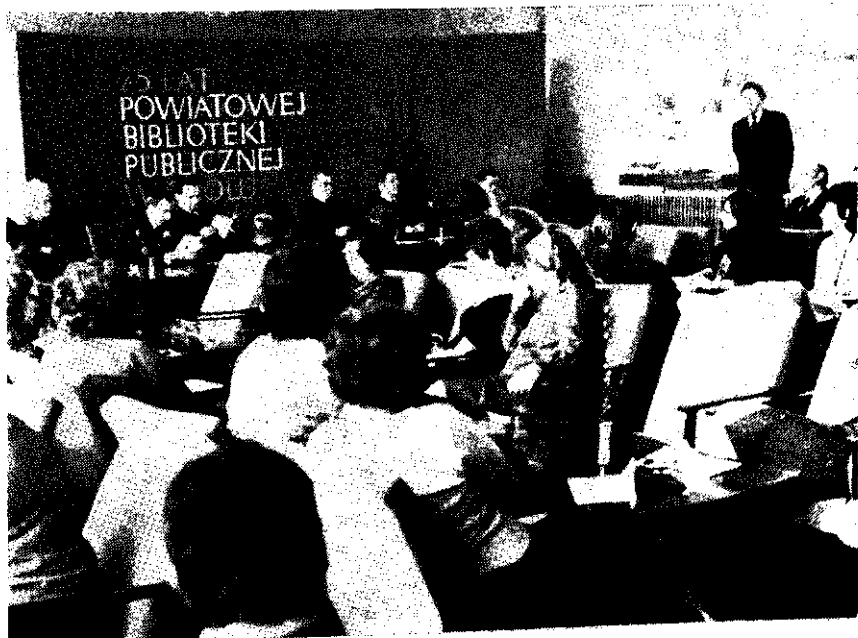
Fragment z obrad 25-lat PBP w Opolu

wiedni dobór księgozbioru, o należytej działalności punktów bibliotecznych. Znaczna i widoczna jest poprawa na tym odcinku. Zyskałiśmy bowiem nowe lokale o stosowniejszym metrażu i wyposażeniu odpowiadającym wymogom i potrzebom pracy bibliotek w Popielowie, Budkownicach St., Komprachcicach, Chrzęstowicach, Zimnicach Wlk., Dąbrówce Dln. i Chróście Op. Inwestuje się nadal środki na nowe lokale w gromadach Przywory Op., Kup, Grudzice i Malina. Z roku na rok zwiększa się również liczba czytelników przy GBP — posiadamy ich obecnie 15. Baza to również zbiory biblioteczne o dynamice wzrostu świadczy wzrost z 0,8 książki na mieszkańca w roku 1960 do 1,6 w roku 1970. Pomimo znacznych dotacji finansowych z PPRN w latach 1969, 1970 sytuacja na tym odcinku nie jest jednak najlepsza.